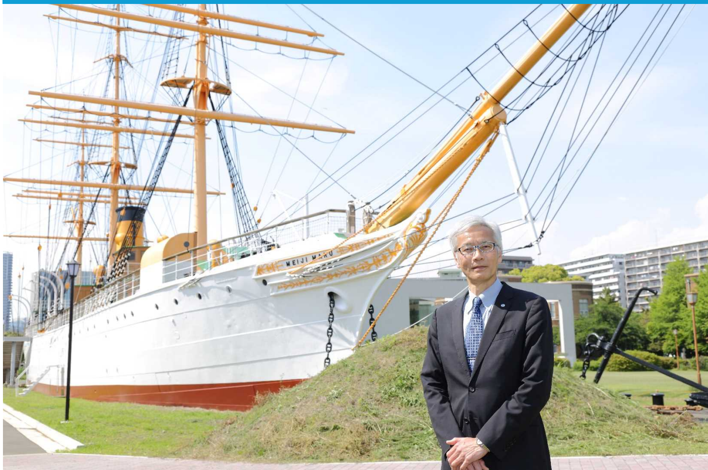
東京海洋大学校友会会長 (東京海洋大学長)