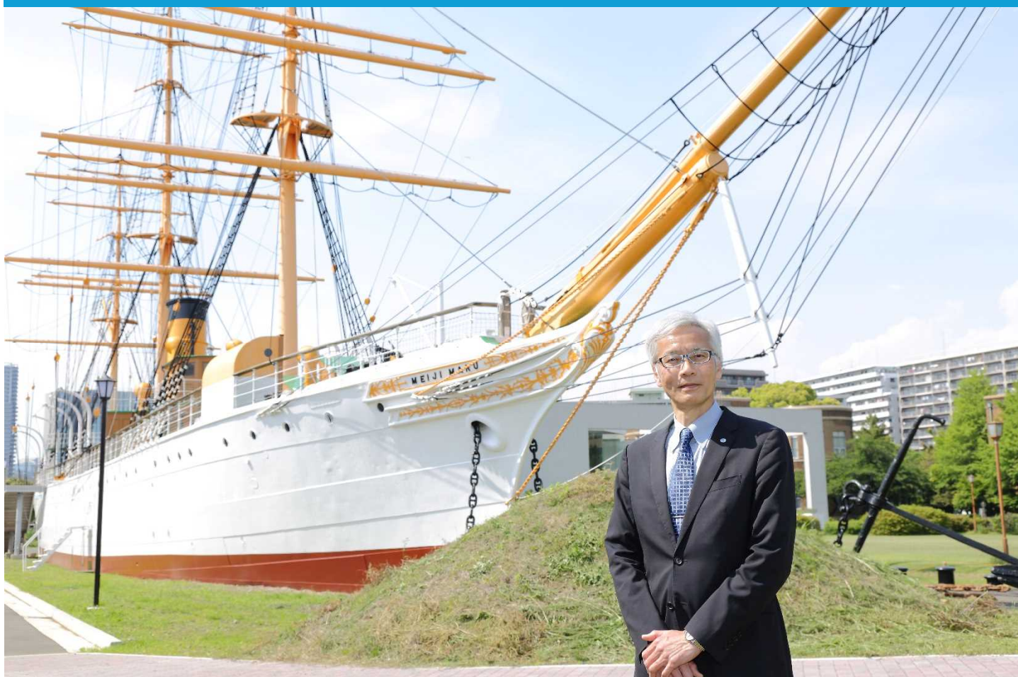
President, TUMSAT Fellowship Association (President, Tokyo University of Marine Science and Technology)