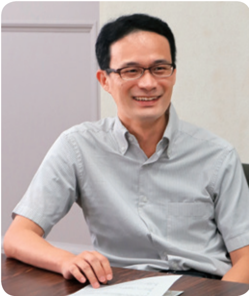
海洋AI開発評価センター副センター長 流通情報工学部門 教授