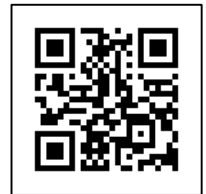
【校友会ホームページQRコード】

海洋大の「今」が分かるコンテンツを少しずつ充実させています。ぜひ、実際に使ってみてください。